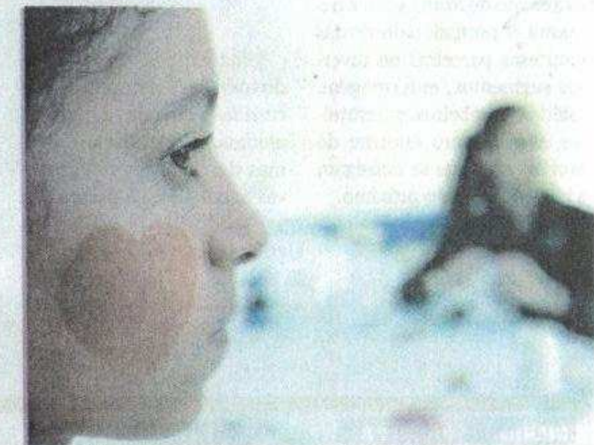
Pintura de rostos foi uma das atividades reservadas para as crianças

ISSN - 1516-6570 9 771516 657033 Política 6 Setecidades 4 Economia 4 Esportes 4 Cultura & Lazer 6 Diário do Grande ABC nos Bairros 4 Imóveis 12 Automóveis 2 Empregos & Oportunidades 2 Nesta edição 50 páginas