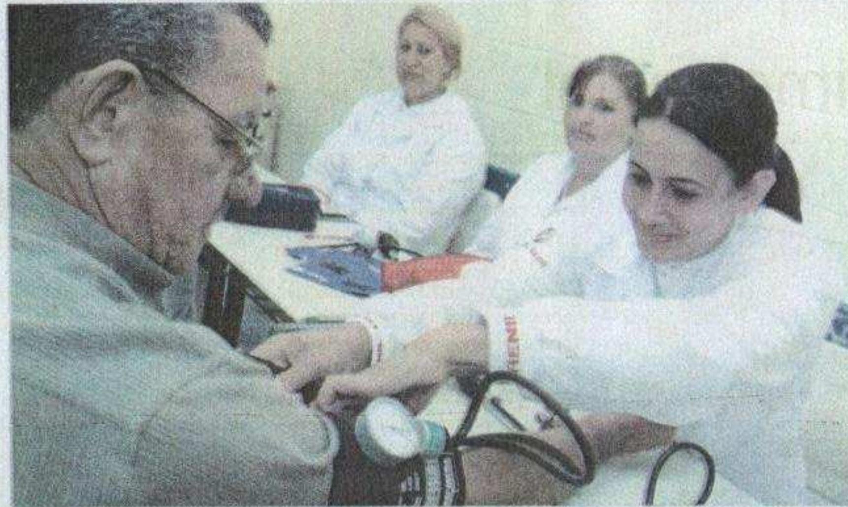
Preocupados com a saúde, os adultos não dispensaram o serviço de aferição de pressão arterial durante o evento

Entre uma escorregada e outra, passaram pela oficina de reciclagem para fazer bonecos e pulseiras com garrafas PET. A fisioterapeuta e monitora da saúde do Programa Es-