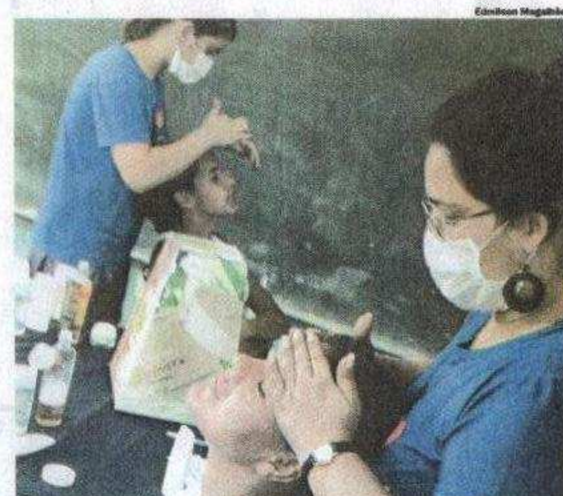
Em Mauá, foi convocado reforço para atender a demanda de limpeza de pele