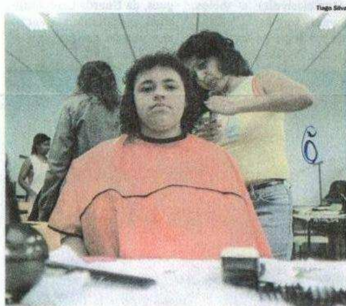
Em Diadema, o serviço de corte de cabelo foi bastante procurado